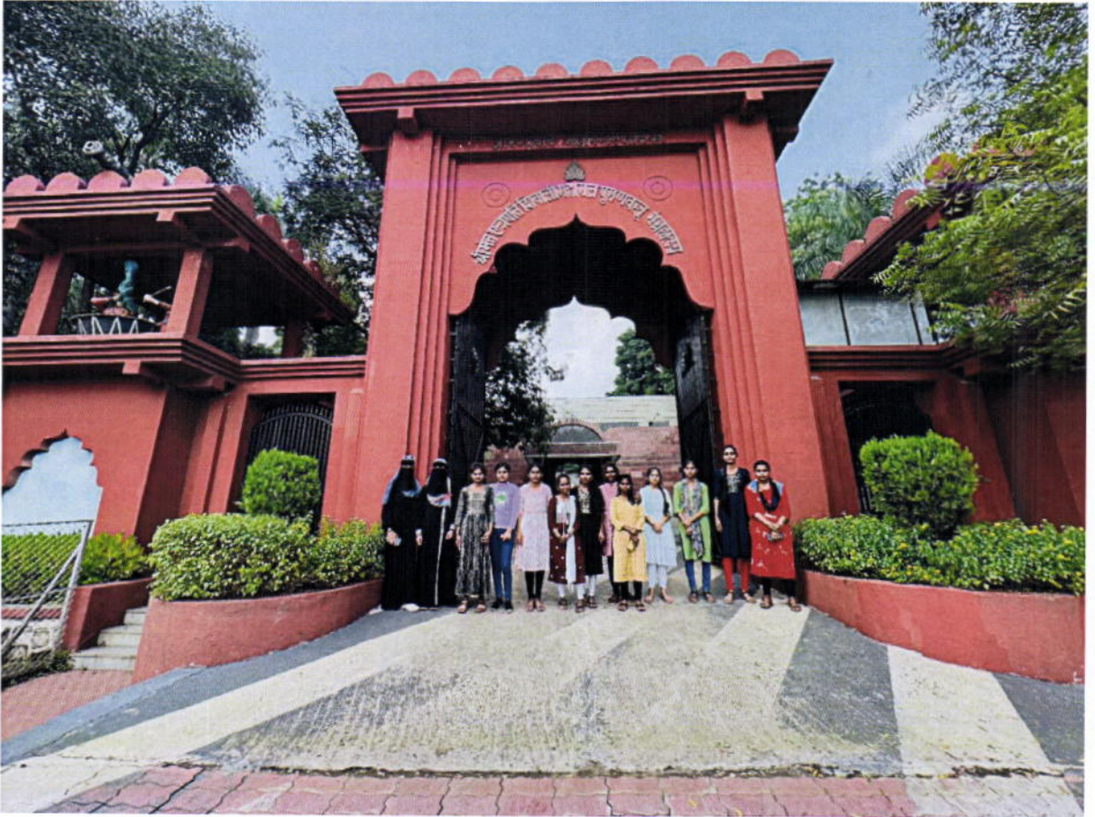
छत्रपती शिवाजी महाराज वस्तुसंग्रहालयातील मोडी कागदपत्रांची पाहणी प्रसंगी विद्यार्थ्यांची भेट