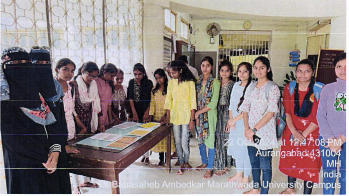
विद्यापीठातील वस्तुसंग्रहालयातील मोडीकागदपत्रांची पाहणी करताना महाविद्यालयातील मोडीचे विद्यार्थी