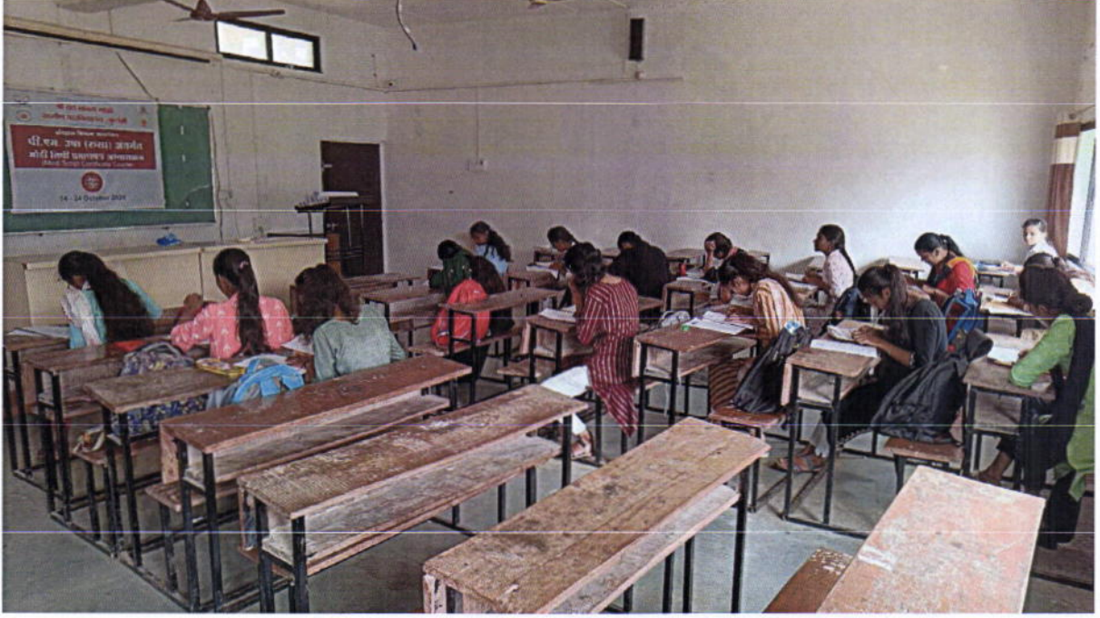
मोडी लिपी प्रमाणपत्र अभ्यासक्रमाची परीक्षा देताना परीक्षार्थी