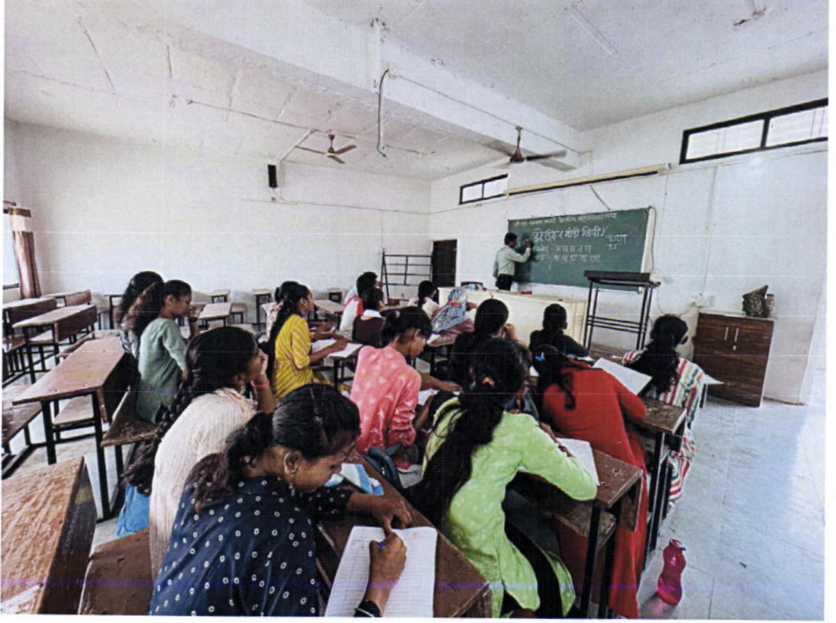
मोडी लिपीचे अध्यापन करताना अध्यापक वर्ग