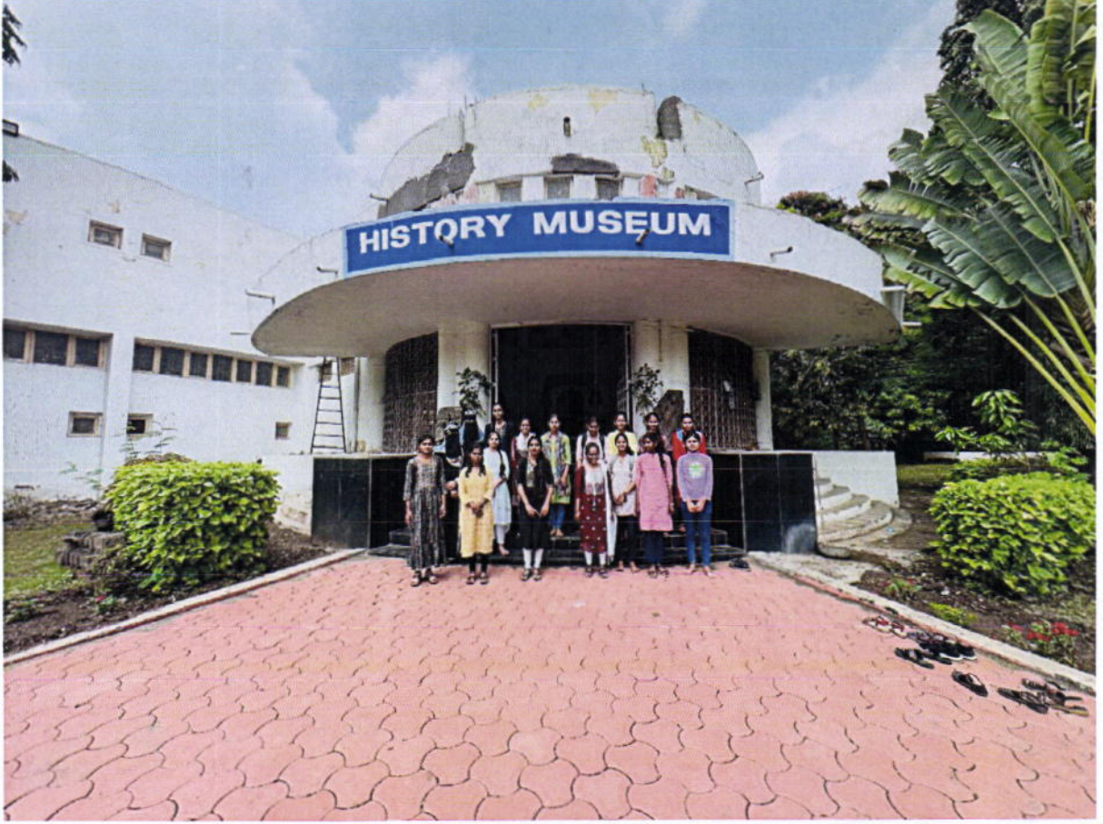
मोडी लिपीच्या कागदपत्रांची पाहणीसाठी शैक्षणिक अभ्यास सहल