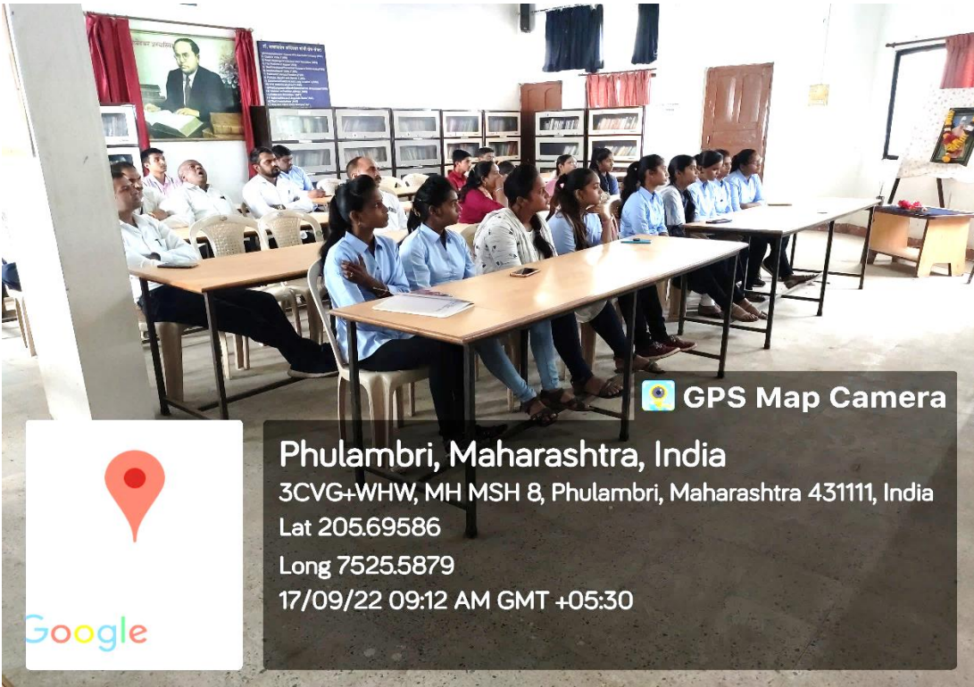
हैदराबाद मुक्तीसंग्राम दिन व्याख्यान प्रसंगी सर्व कर्मचारी