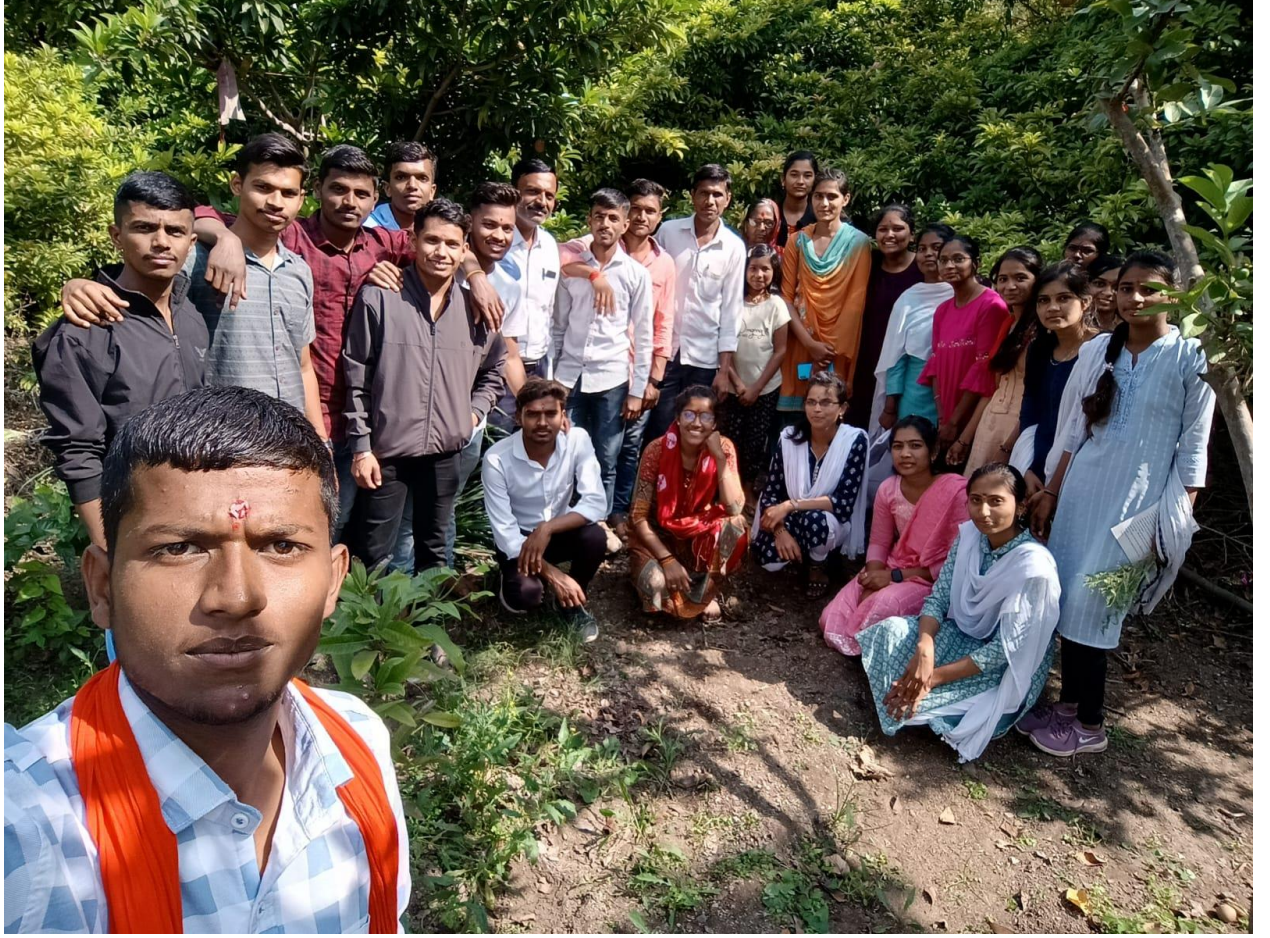
सर्वेक्षण- गावकऱ्यांकडून प्रश्नावली भरून घेतली

२३. सर्वेक्षण – ‘हवामान बदलाचा गणोरी गावातील पिक परिस्थितीवर झालेला परिणाम’ यावर सर्वेक्षण करण्यात आले.