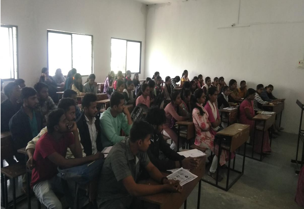
जागतिक एडस दिन व्याख्यान - उपस्थित स्वयंसेवक