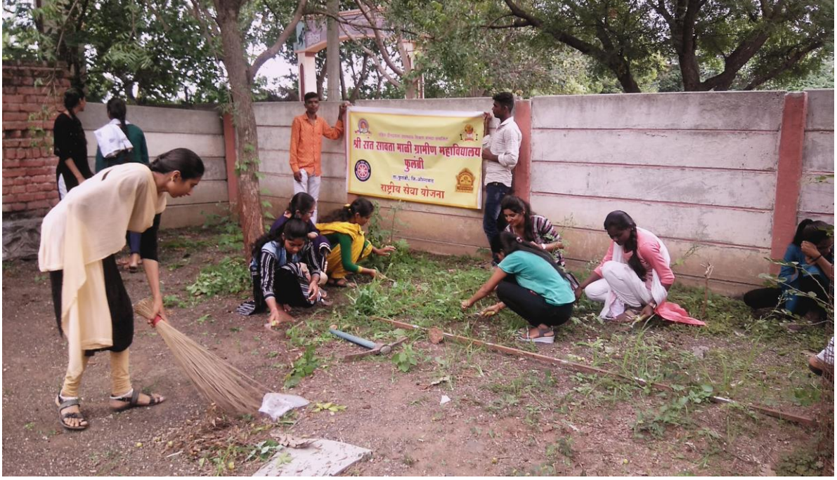
स्वच्छतेसाठी श्रमदान करताना स्वयंसेवक