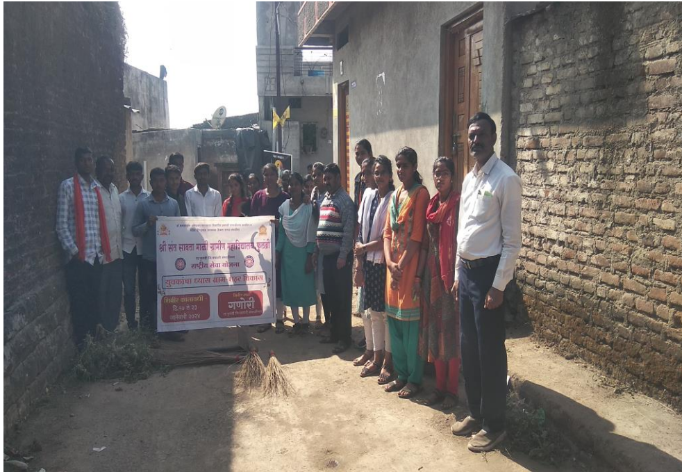
गावात विविध ठिकाणी श्रमदान केले