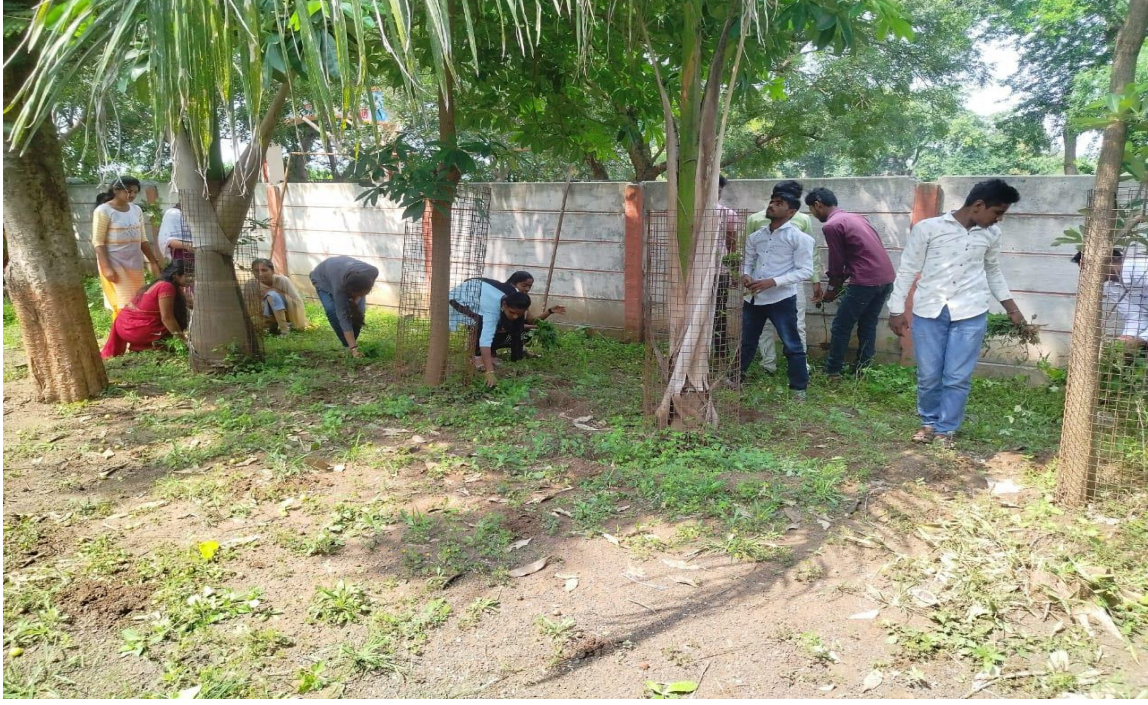
श्रमदान- सहभागी विद्यार्थी