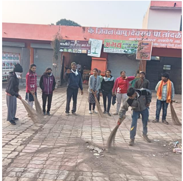
ग्राम स्वच्छता करताना स्वयंसेवक व स्वयंसेविका