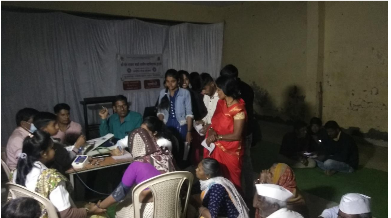
आरोग्य तपासणी करताना डॉक्टर