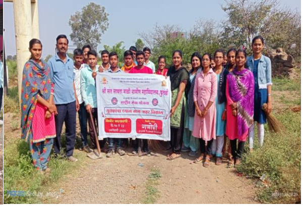
जिल्हा परिषद प्राथमिक शाळा येथे श्रमदान केले