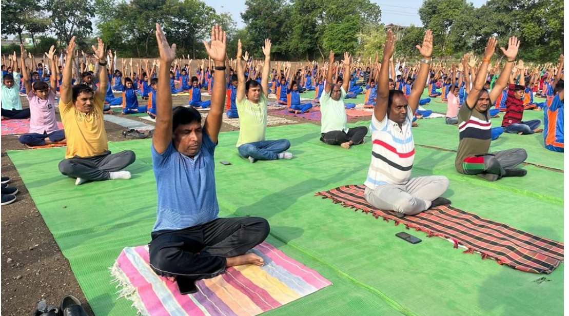
योग - प्राणायाम शिबीर