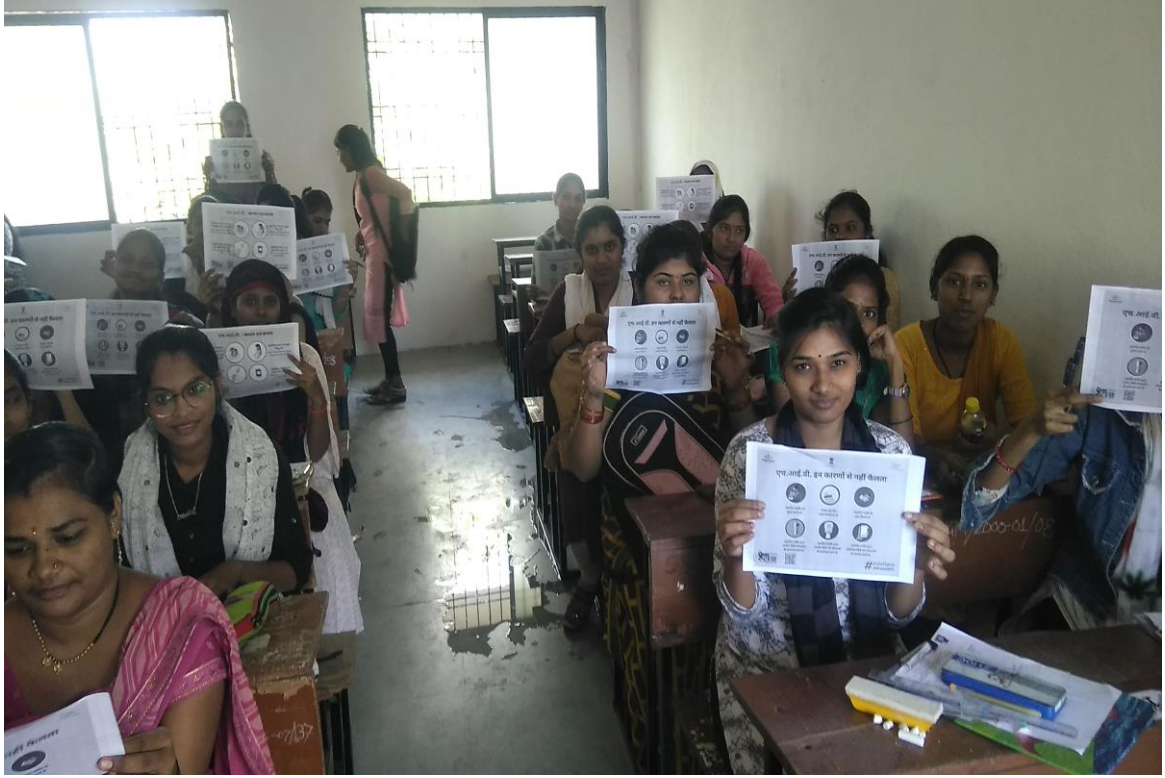
विद्यार्थ्यांना एडस विषयी माहिती पत्रके वाटप करण्यात आले