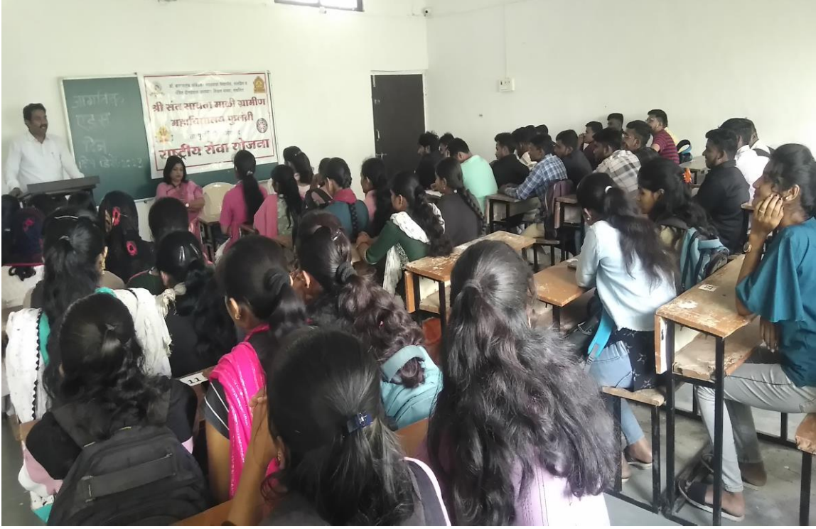
जागतिक एडस दिन व्याख्यान - उपस्थित स्वयंसेवक