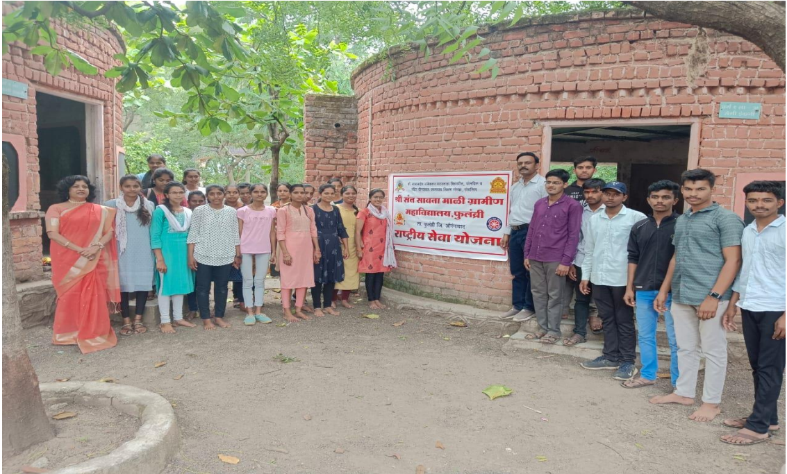
स्वसंरक्षण प्रशिक्षणासाठी उपस्थित स्वयंसेवक