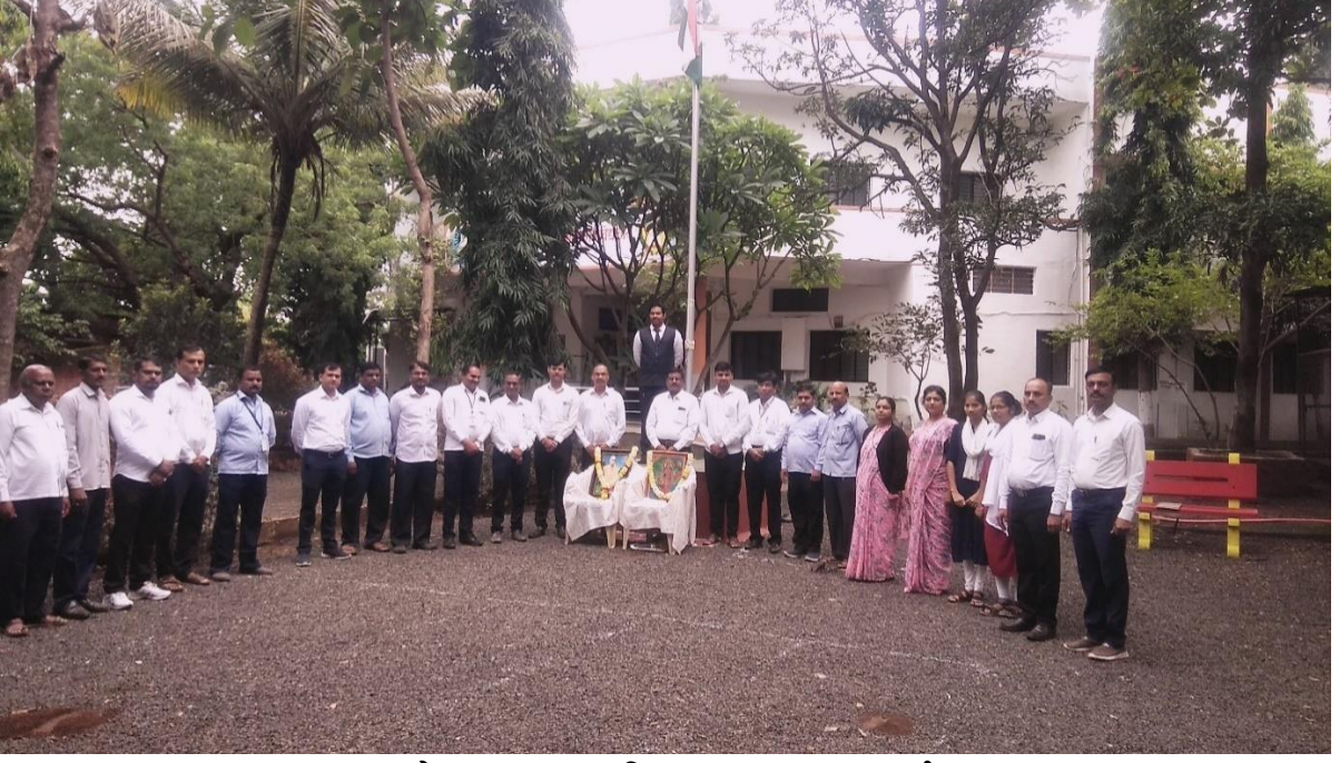
ध्वजारोहन प्रसंगी उपस्थित प्राध्यापक व कर्मचारी