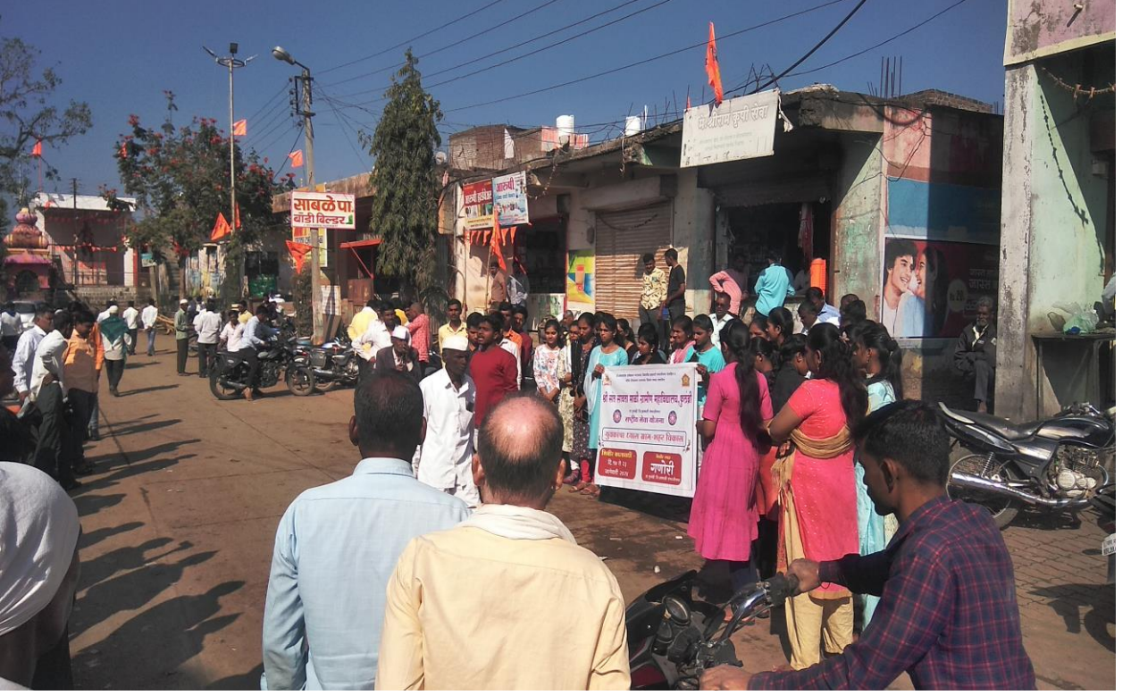
गणोरी गावात विविध ठिकाणी 'बचत पाण्याची समृद्धी जीवनाची' पथनाट्य सदर केले