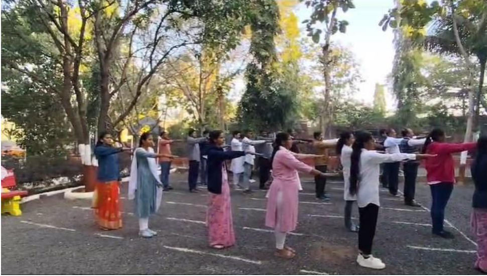
तंबाखू मुक्तीची शपथ कार्यक्रम