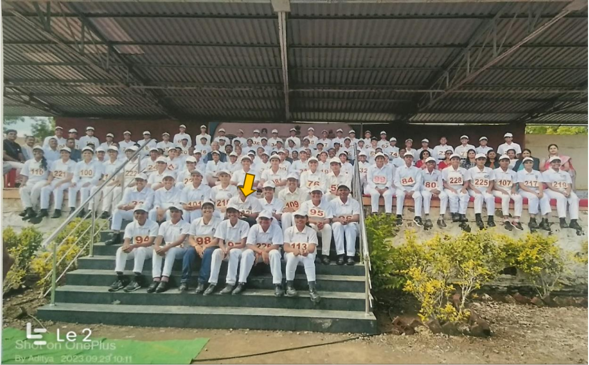
महाराष्ट्र राज्यस्तरीय निवड शिबीर सोलापूर