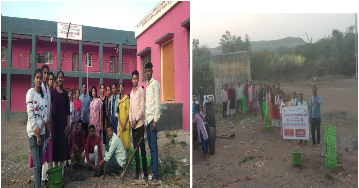
जिल्हा परिषद प्राथमिक शाळेच्या प्रांगणात वृक्षारोपण केले