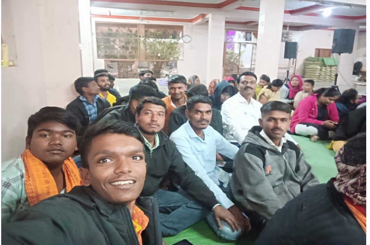
समाजप्रबोधन व भारुड कार्यक्रमास उपस्थित स्वयंसेवक व गावकरी