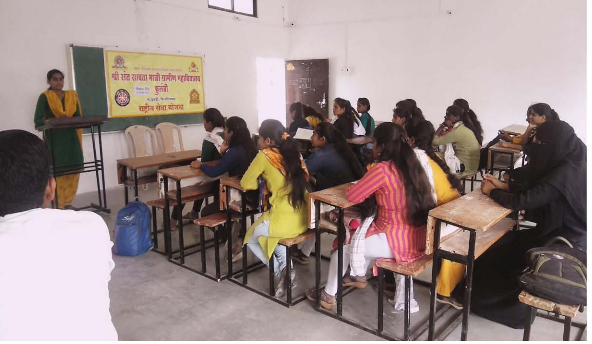
शिक्षक दिन निमित्ताने अध्यापन करताना विद्यार्थिनी