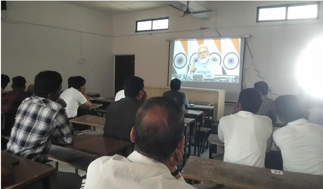
माननीय पंतप्रधान नरेंद्र मोदी यांचे विकसित भारत @२०४७ - लाईव्ह व्याख्यान

दिनांक ११ डिसेंबर २०२३ रोजी सकाळी १०:०० वाजता माननीय पंतप्रधान नरेंद्र मोदी यांचे विकसित भारत @२०४७ - लाईव्ह व्याख्यानास महाविद्यालयातील राष्ट्रीय सेवा योजना स्वयंसेवक, प्राध्यापक व कर्मचारी उपस्थित होते.