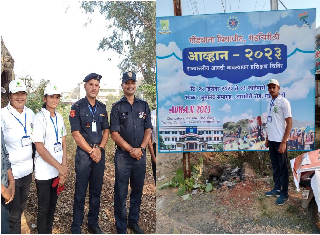
गडचिरोली - आपत्ती व्यवस्थापन प्रशिक्षण शिबिरात सहभागी स्वयंसेवक