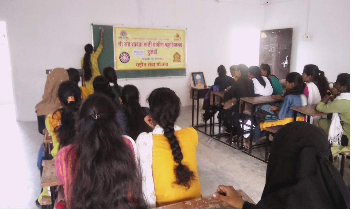
शिक्षक दिन निमित्ताने अध्यापन करताना विद्यार्थिनी