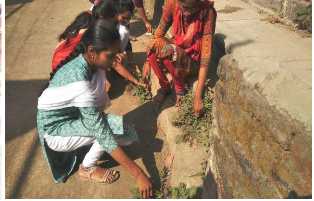
गावात विविध ठिकाणी श्रमदान केले