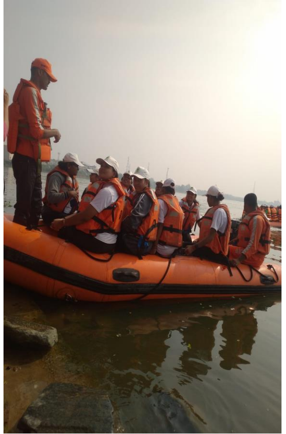
गडचिरोली - आपत्ती व्यवस्थापन प्रशिक्षण शिबिरात सहभागी स्वयंसेवक