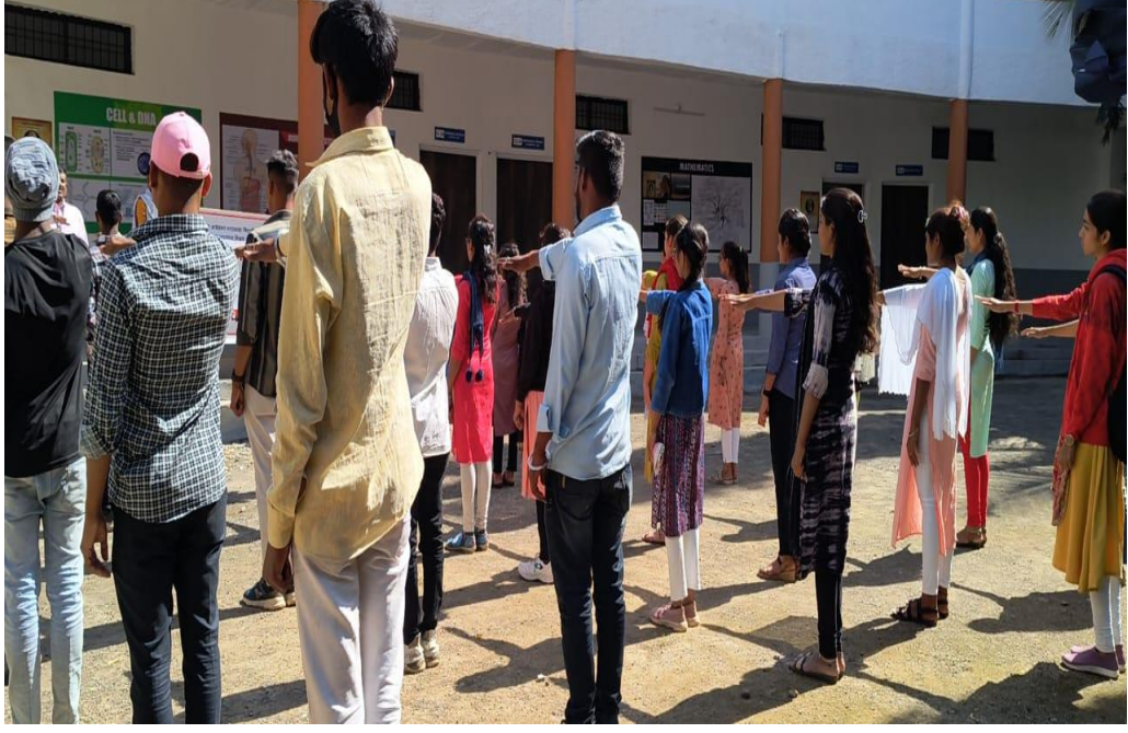
मतदार दिन प्रतिज्ञा - प्राचार्य, प्राध्यापक व विद्यार्थी