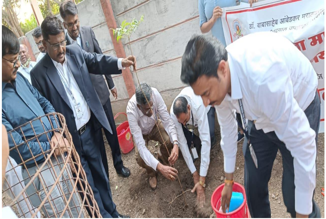
वृक्षारोपण- ३१ ऑक्टोबर २०२३ महाविद्यालयात आलेल्या NAAC समिती सदस्यांच्या हस्ते वृक्षारोपण करण्यात आले.