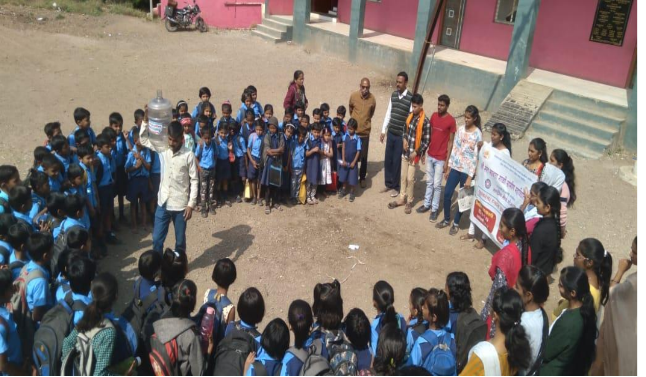
गणोरी गावातील प्राथमिक शाळेत 'बचत पाण्याची समृद्धी जीवनाची' पथनाट्य सदर केले