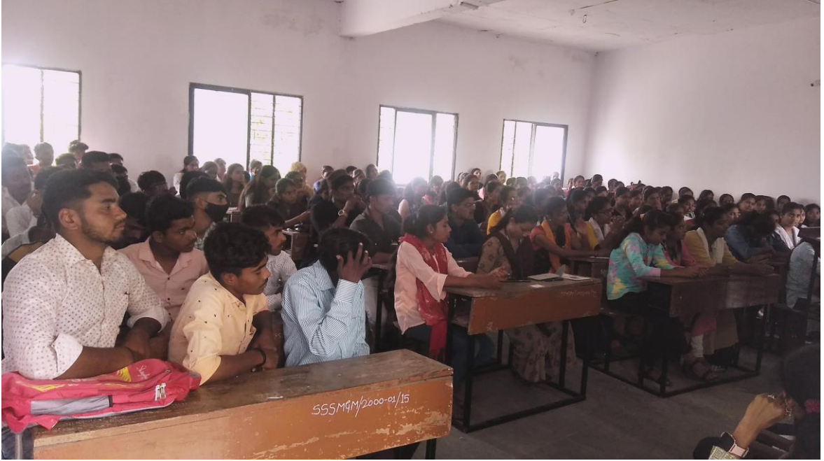
विद्यार्थी संवाद कार्यशाळा'- विद्यार्थ्यांना राष्ट्रीय सेवा योजनेची माहिती देण्यात आली.