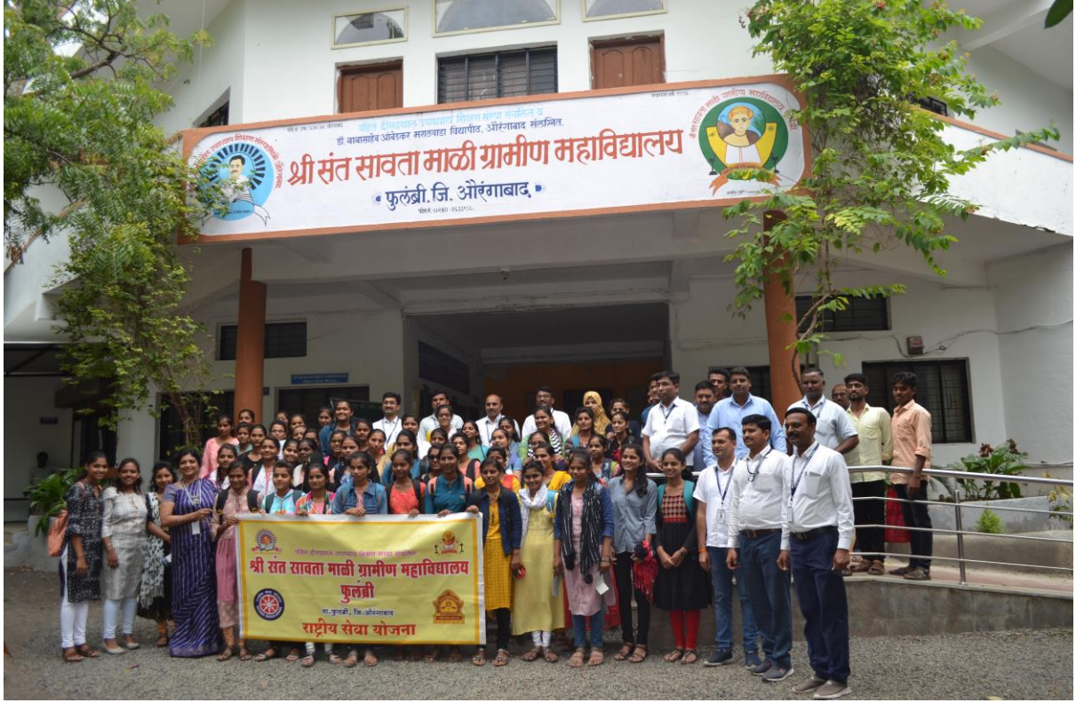
राष्ट्रीय सेवा योजनेत नाव नोंदविलेले विद्यार्थी