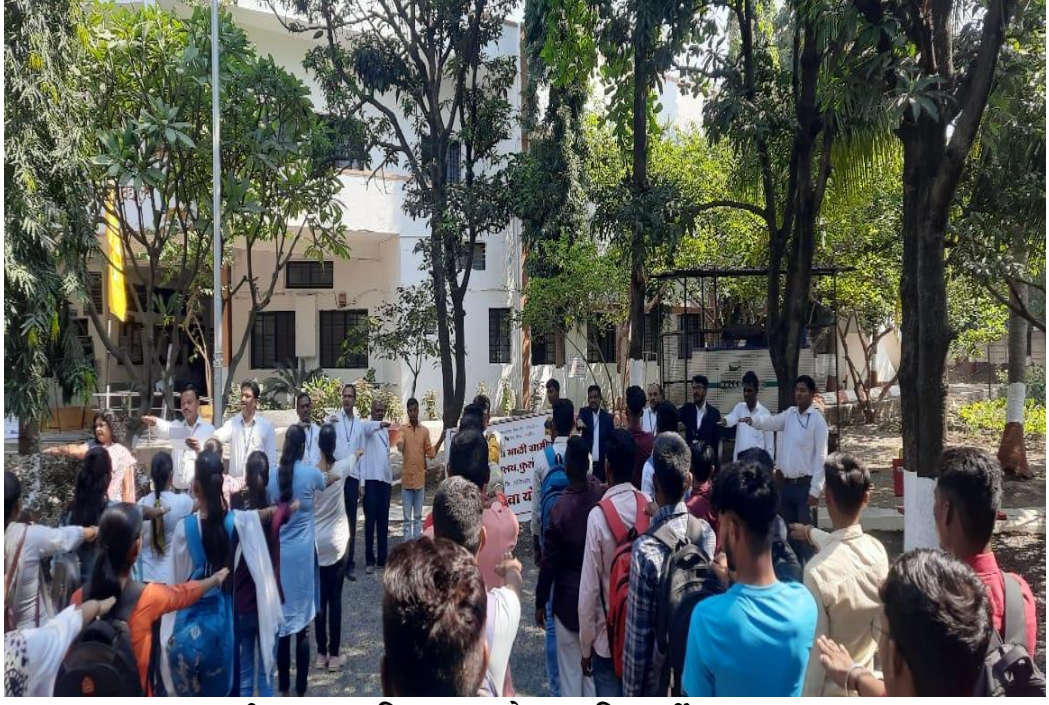
राष्ट्रीय एकता दिन शपथ घेताना विद्यार्थी व प्राध्यापक