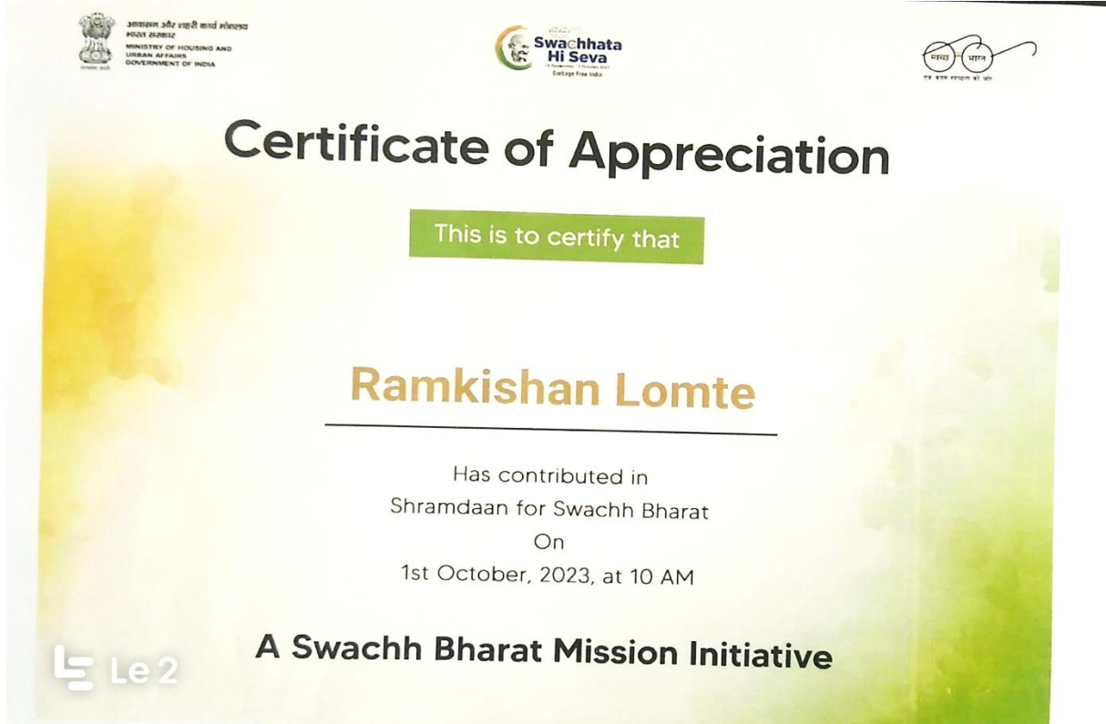
श्रमदान- सहभाग प्रमाणपत्र