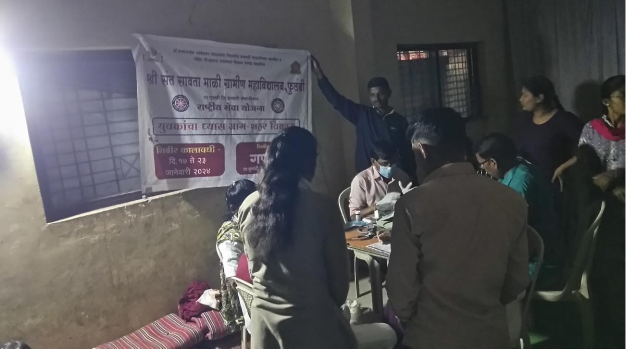
आरोग्य तपासणी करताना डॉक्टर