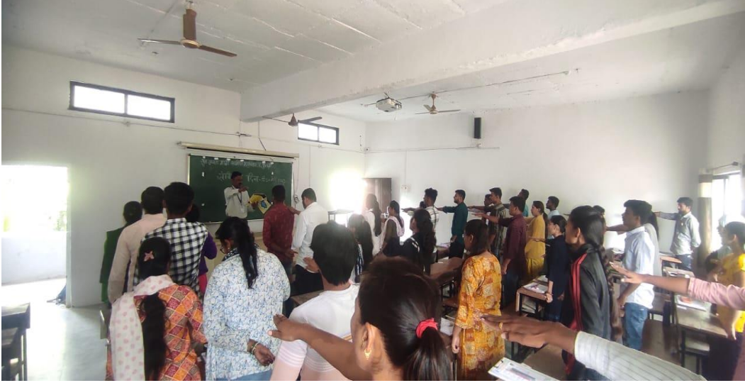
उद्देशपत्रिका वाचन करताना विद्यार्थी

दि.२६ नोव्हेंबर २०२३ रोजी संविधान दिन निमित्ताने उद्देशपत्रिका वाचन करण्यात आले. भारतीय संविधानाविषयी विद्यार्थ्यांना माहिती असली पाहिजे या दृष्टीकोनातून Google Quiz तयार करण्यात आली. संविधानाविषयी प्रश्न विचरण्यात आले. प्रत्येक प्रश्नाला चार पर्याय देण्यात आले. विद्यार्थ्यांना whatsapp Group वर Quiz ची लिंक पाठविण्यात आली व विद्यार्थ्यांकडून भरून घेतली.