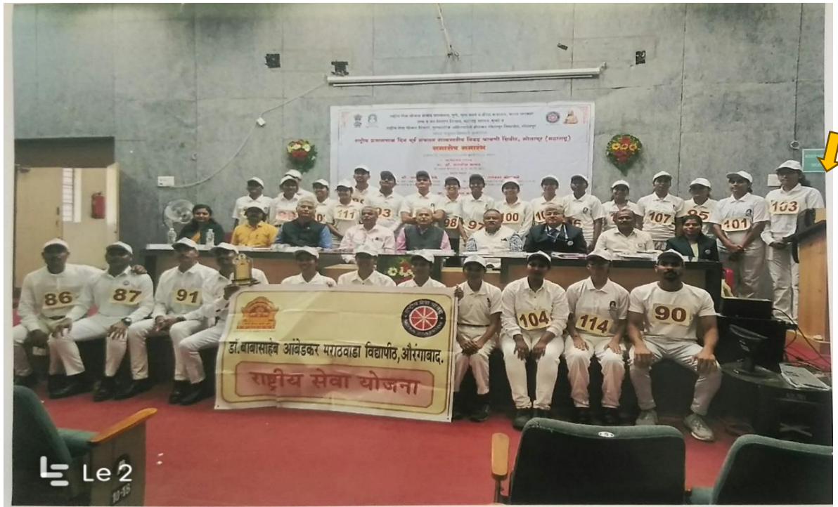
महाराष्ट्र राज्यस्तरीय निवड शिबीर सोलापूर