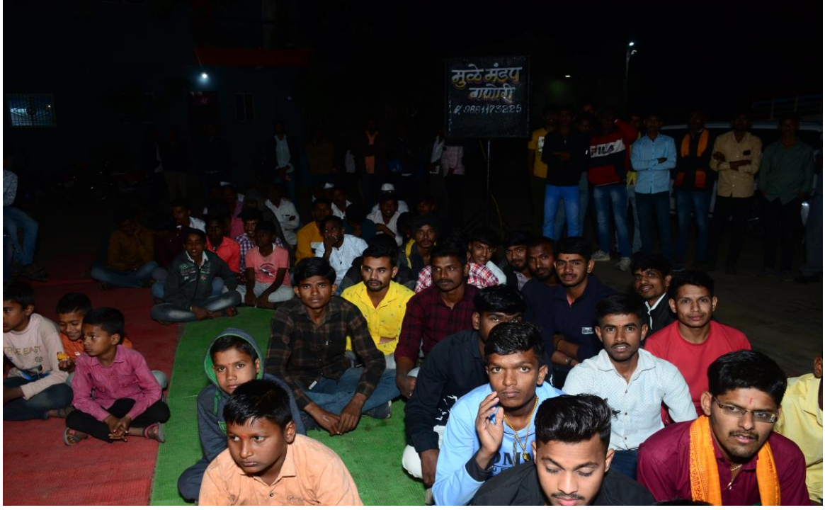
कार्यक्रमाला उपस्थित गावकरी व स्वयंसेवक