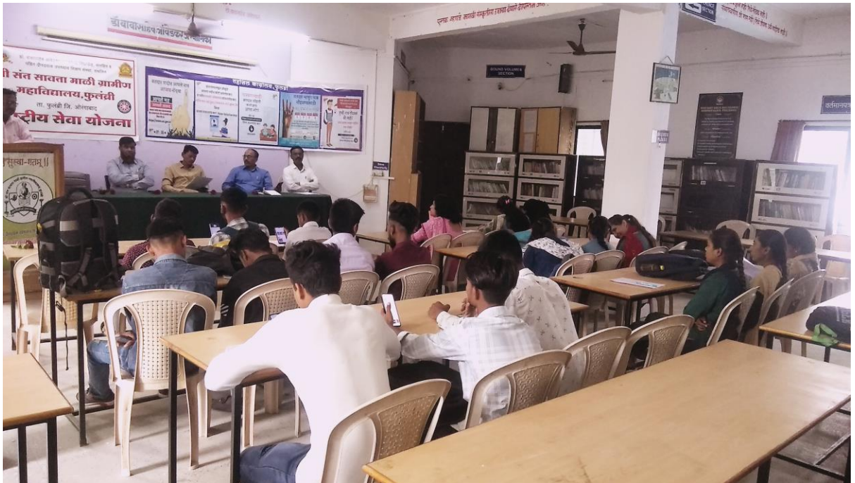
मतदार नोंदणी मार्गदर्शन शिबीर