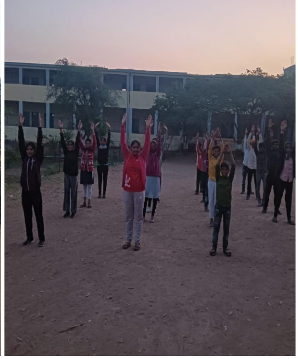
व्यायाम करताना स्वयंसेवक व स्वयंसेविका

१७. शिबिरातील दैनंदिन उपक्रम - ग्राम स्वच्छता:- दररोज सकाळी ७ ते ९:०० वा.