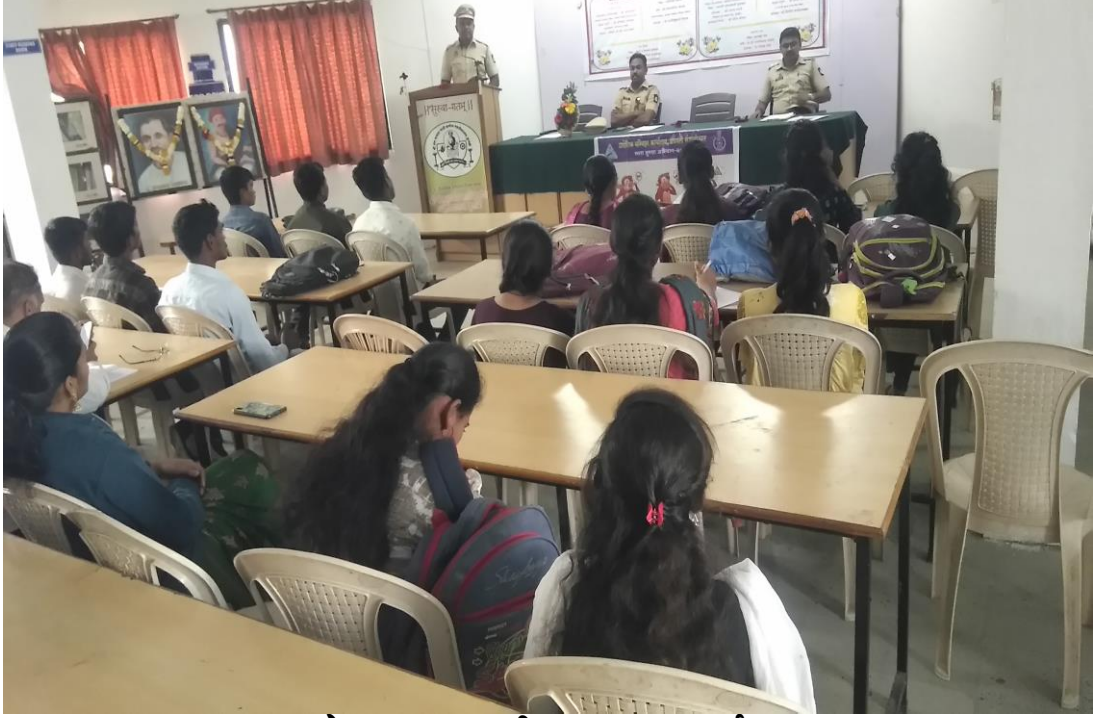
रस्ते सुरक्षा जागृती व्याख्यान कार्यक्रम

आहे. यावेळी वाहतूक विषयक नियमांची माहिती दिली. या बरोबरच कार्यक्रमाच्या शेवटी रस्ते सुरक्षा शपथ देण्यात आली. या कार्यक्रमास ६२ स्वयंसेवक उपस्थित होते.