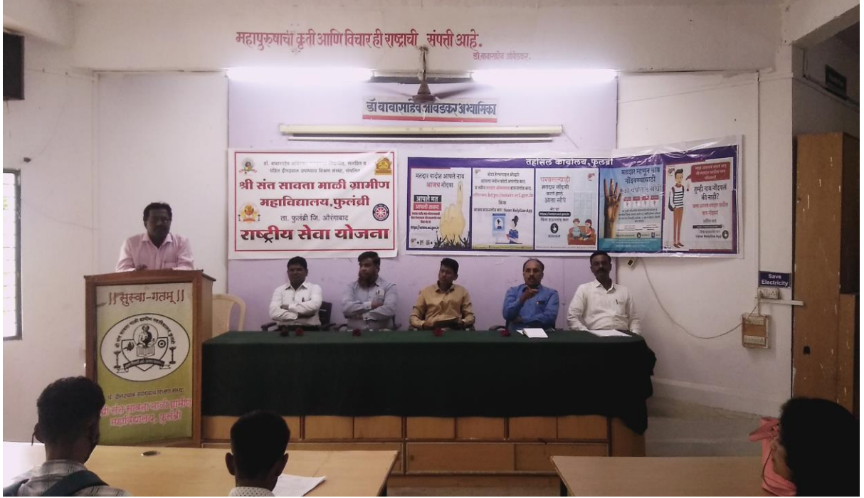
मतदार नोंदणी मार्गदर्शन शिबीर