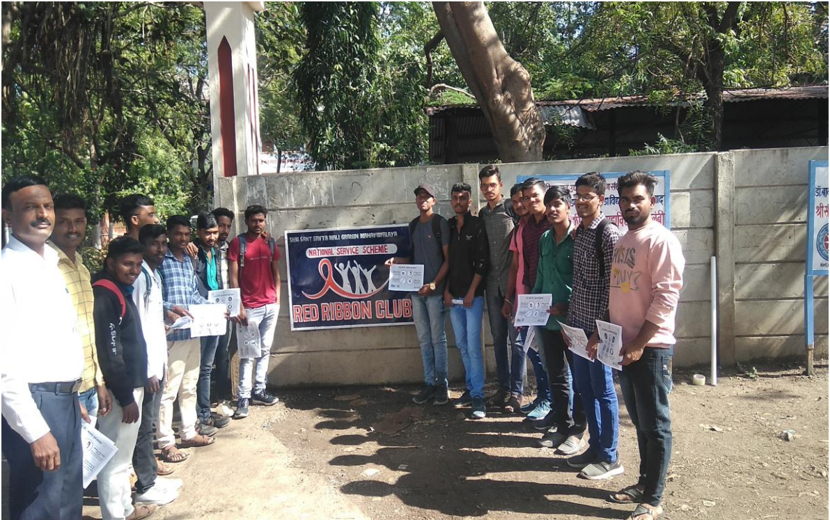
रेड रिबीन क्लबची स्थापना