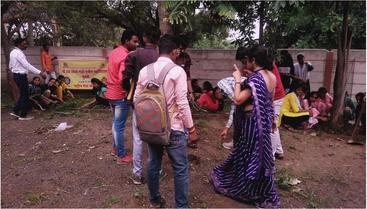
श्रमदान करताना स्वयंसेवक