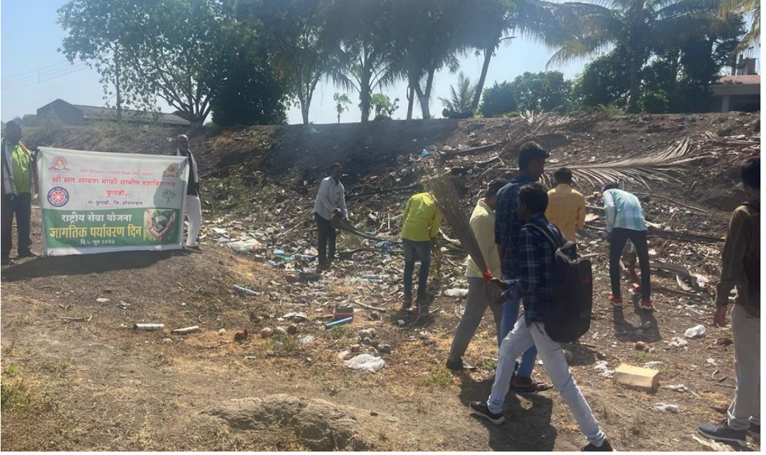
धरणातील प्लास्टिक कचरा संकलन करताना स्वयंसेवक

राष्ट्रीय सेवा योजना विभागाच्या वतीने दिनांक ५ जुन २०२३ रोजी जागतिक पर्यावरण दिनाच्या निमित्ताने फुलंब्री जवळच्या धरणातील प्लास्टिक कचरा संकलित करून धरण स्वच्छ करण्यात आले. यावेळी ४७ स्वयंसेवक, महाविद्यालयातील प्राध्यापक व कर्मचारी यांनी श्रमदानात सहभाग घेतला.