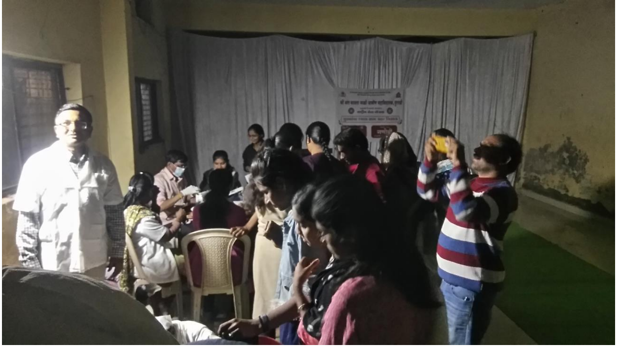
आरोग्य तपासणी करताना डॉक्टर