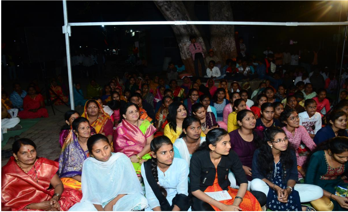
कार्यक्रमाला उपस्थित गावकरी व स्वयंसेवक