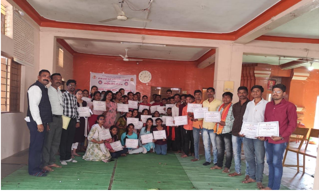
समारोप प्रसंगी सामुहिक छायाचित्र

१६. शिबिरातील दैनंदिन उपक्रम - व्यायाम:- दररोज सकाळी ६:०० ते ७:०० वा.