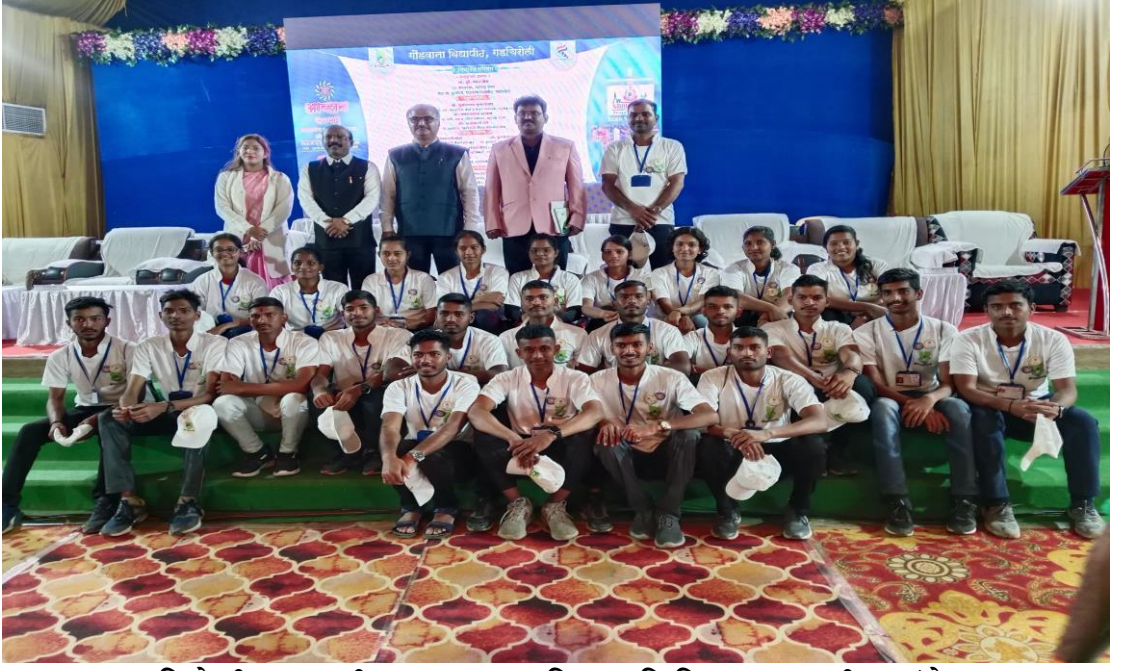
गडचिरोली - आपत्ती व्यवस्थापन प्रशिक्षण शिबिरात सहभागी स्वयंसेवक