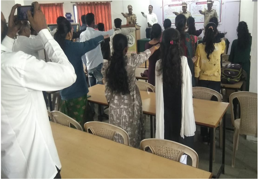
रस्ते सुरक्षा शपथ