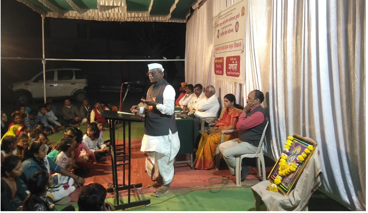
फुलंब्री विधानसभा मतदारसंघाचे आमदार माननीय श्री हरिभाऊ बागडे नाना शिबिरात मार्गदर्शन करताना

गावांमध्ये शिबिर संपन्न होत आहे याचा मला आनंद वाटत आहे. याप्रसंगी गावकऱ्यांनी आपल्या मुलांना महाविद्यालयात पाठवावे नियमित महाविद्यालयामध्ये पाठवून शिक्षण घेण्यासाठी प्रेरित करावे अशा प्रकारचे त्यांनी विचार व्यक्त केले.