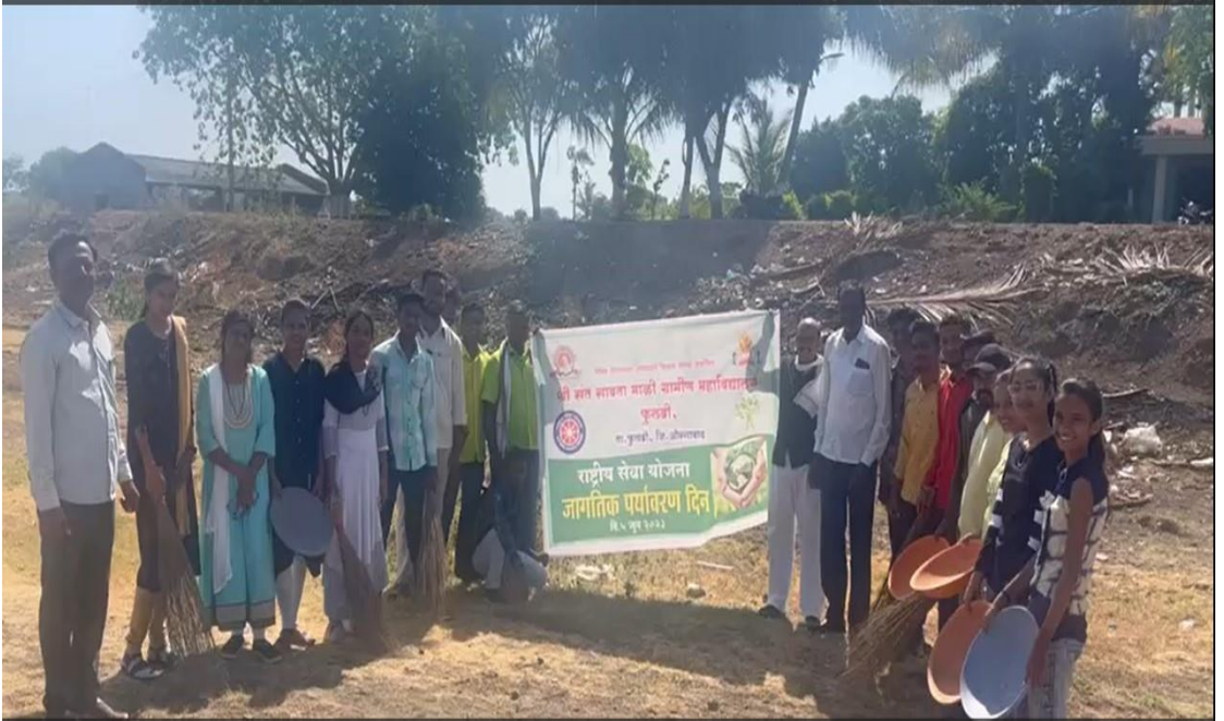
धरणातील प्लास्टिक कचरा संकलन