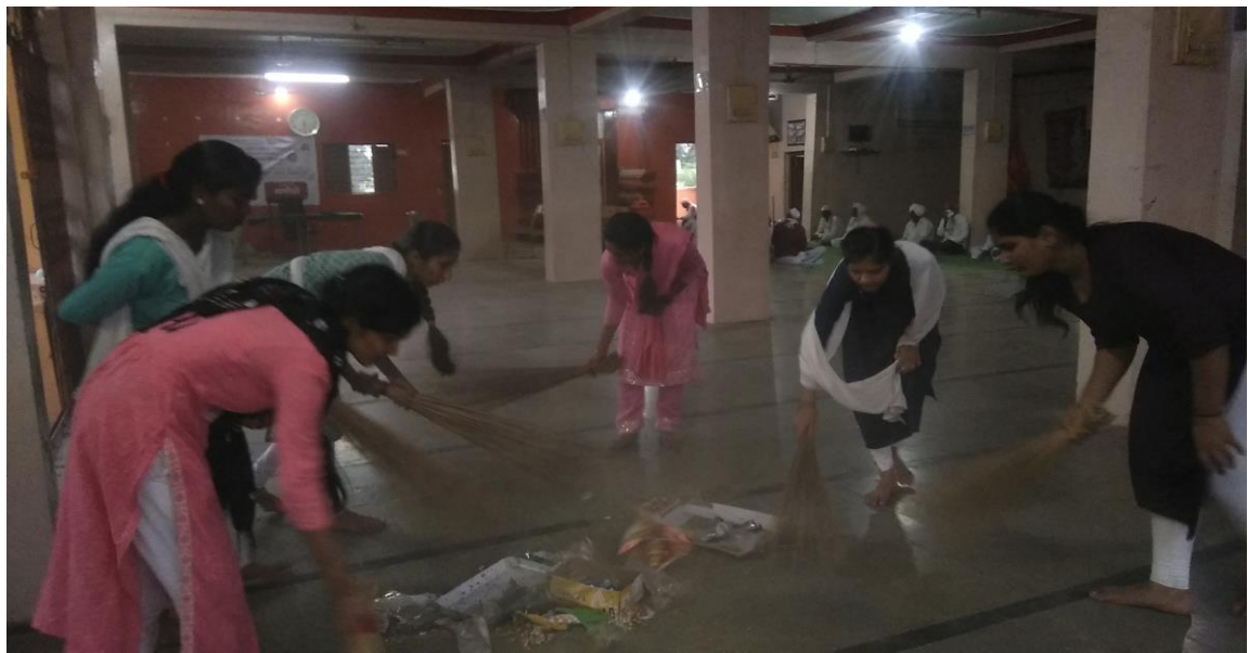
स्वच्छता करताना स्वयंसेवक