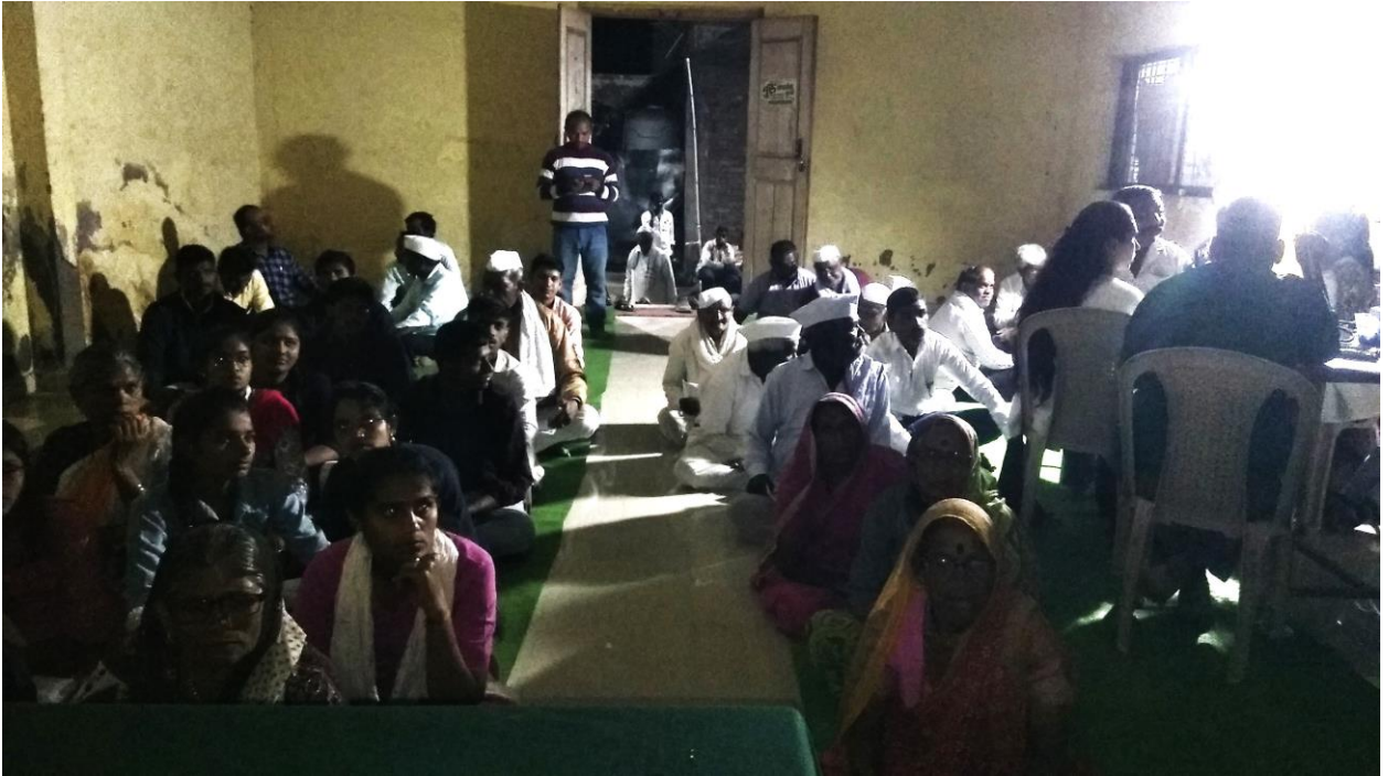
आरोग्य तपासणी व मार्गदर्शन कार्यक्रमासाठी उपस्थित नागरिक व स्वयंसेवक