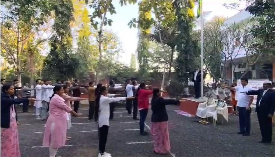
तंबाखू मुक्तीची शपथ कार्यक्रम