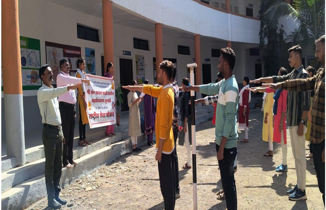
मतदार दिन प्रतिज्ञा - प्राचार्य, प्राध्यापक व विद्यार्थी

“आम्ही, भारताचे नागरिक, लोकशाहीवर निष्ठा ठेवून, याद्वारे, प्रतिज्ञा करतो की, आपल्या देशाच्या लोकशाही परंपरांचे जतन करू आणि मुक्त निःपक्षपाती व शांततापूर्ण वातावरणातील निवडणूकांचे पावित्र्य राखू व प्रत्येक निवडणूकीत निर्भयपणे तसेच धर्म, वंश, जात, समाज, भाषा यांच्या विचारांच्या प्रभावाखाली न येता किंवा कोणत्याही प्रलोभनास बळी न पडता मतदान करू.”