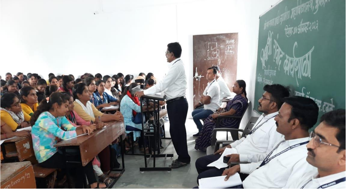
विद्यार्थी संवाद कार्यशाळा'- राष्ट्रीय सेवा योजनेची माहिती देण्यात आली.