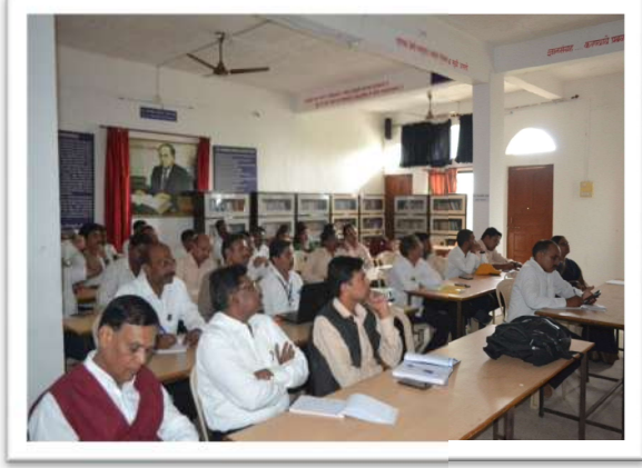
कार्यशाळेत सहभागी प्राध्यापक वर्ग