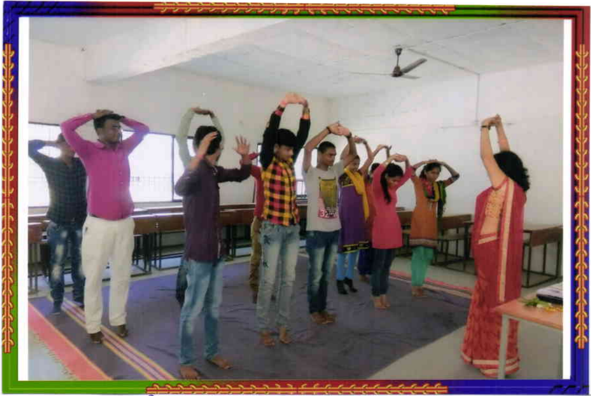
विद्यार्थी योगासन करताना.